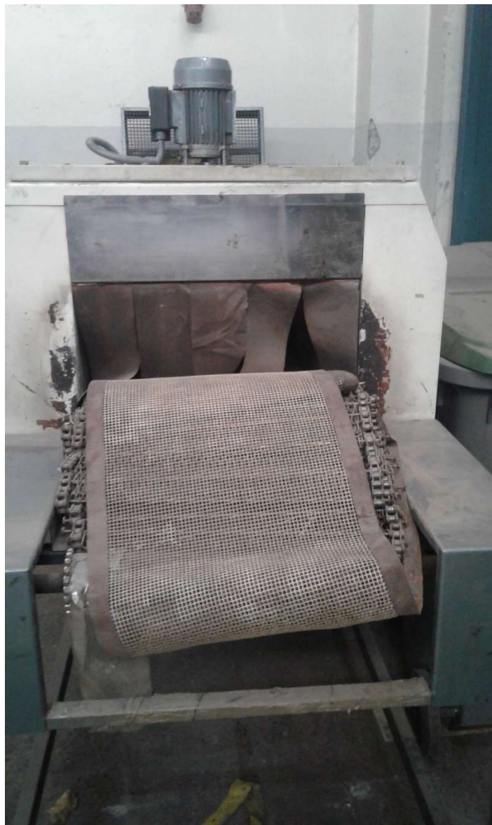
HORNO PARA EMBALAJE CON POLIETILENO RETRACTIL MODELO MONTESA LOTE 9