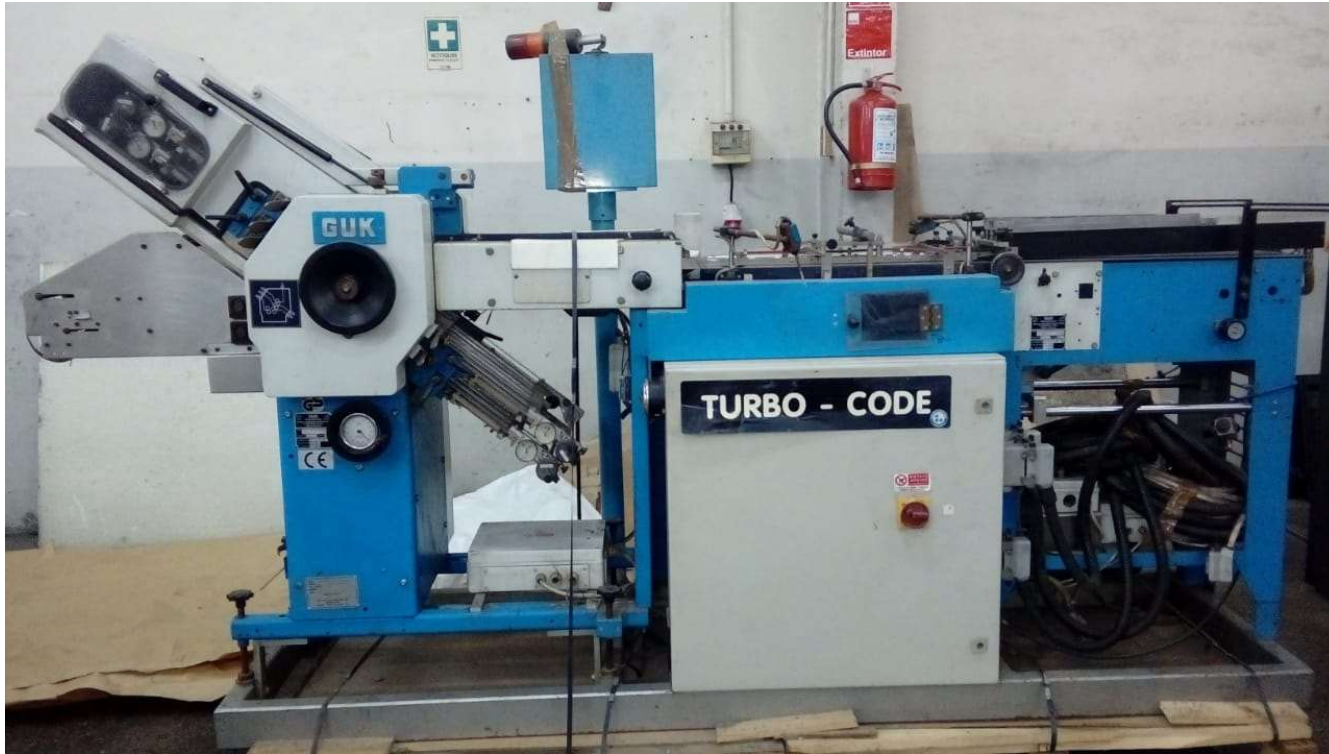
MAQUINA DOBLADORA GUK 30/4 AT30 LOTE 12