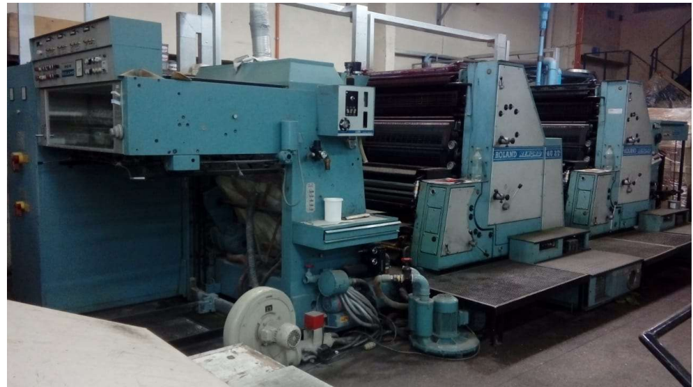
MAQUINA ROLAND REKORD 4/0 2/2 FORMATO 72 X 102 CON RCI Y CALCE DISTANCIA REMOTO

TURBINA DE REPUESTO RODILLOS DE BATERIA DE REPUESTO REPUESTOS VARIOS TIPO RUK 3B SERIE 630 N° 14716 B