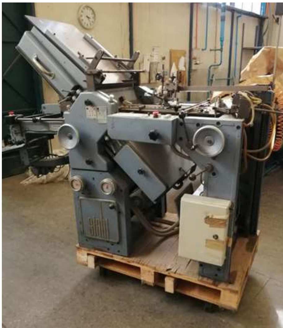
MAQUINA DOBLADORA STAHL K-44 TARJETAS DESDE 6.5 X 4.8 A 1/4 PLIEGO LOTE 6