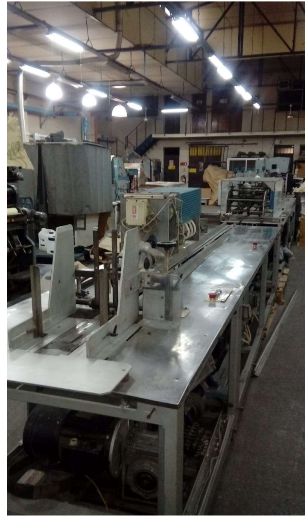
MAQUINA C M C RITMICA ORIGEN ITALIANO (DESARMADA) PROCESADORA DE 5 ESTACIONES PARA CORRESPONDENCIA EN BOLSA PLASTICA SELLADA + 2 DOBLADORAS GUK Y UN CARGADOR AUTOMATICO LOTE 10