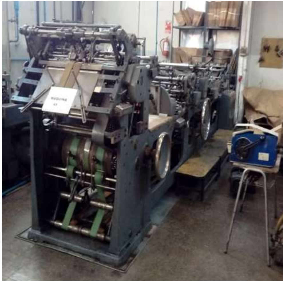
MAQUINA 41 WINKLER DUNNEBIER N° 315 MS 0410 B140 AÑO 1997 ARMADORA DE SOBRES Y SACOS

FORMATOS CUARTO OFICIO 13 X 19 -MEDIA CARTA 15 X 22.5 -MEDIO OFICIO 20 X 26 Y OFICIO 24 X 33.7 CON SUS RESPECTIVOS REPUESTOS