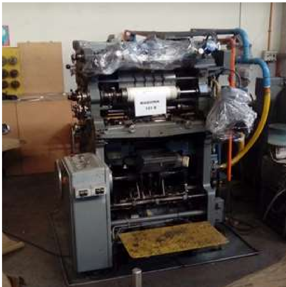
MAQUINA 131 B WINKLER DUNNEBIER N° 7547 AÑO 1969 PARA APLICACIÓN DE VENTANA Y CELOFAN LOTE 7