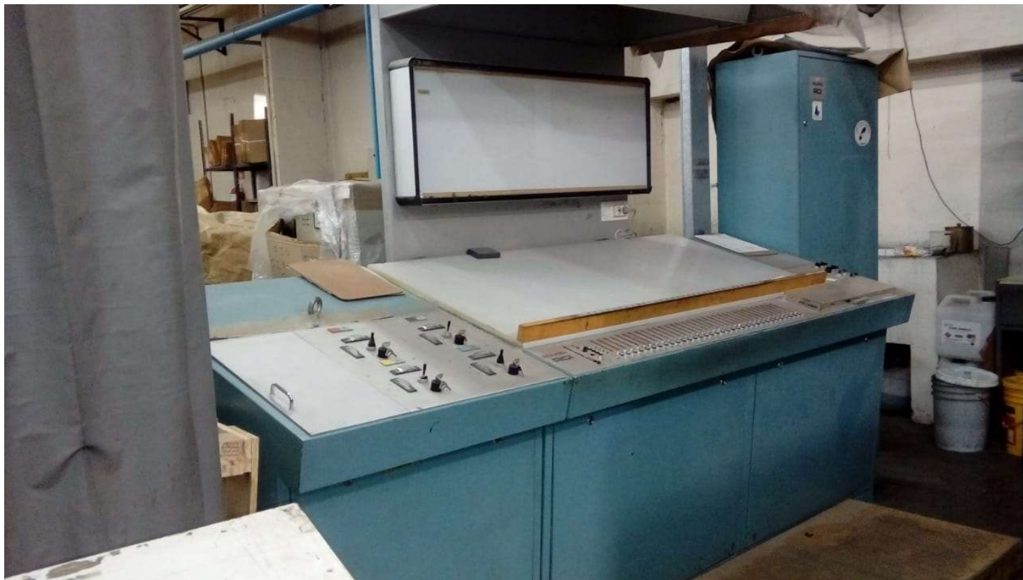
MESA RCI MAQUINA ROLAND REKORD CONTROL A DISTANCIA