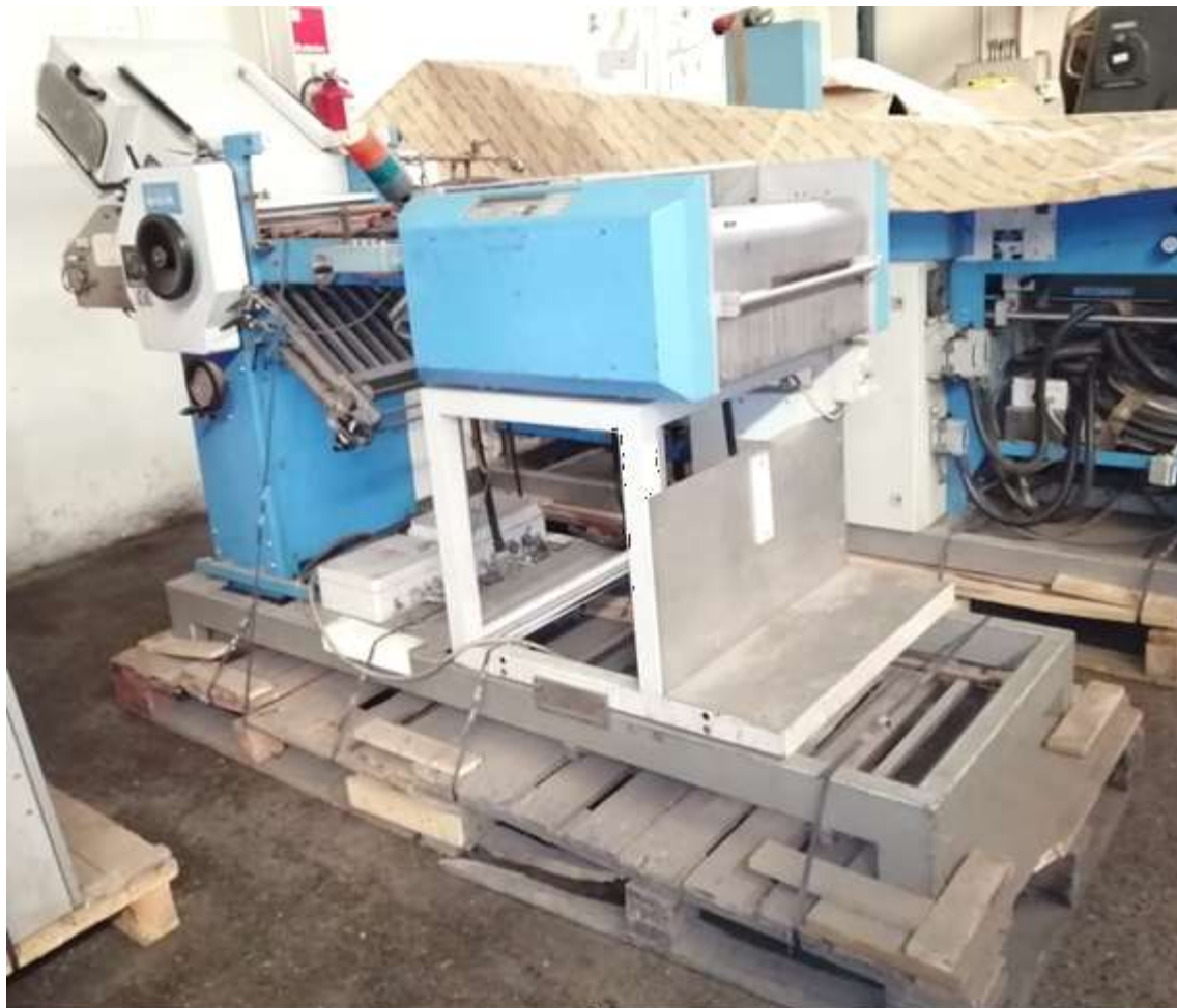
MAQUINA DOBLADORA GUK FA 30 /4 SA 30 LOTE 13