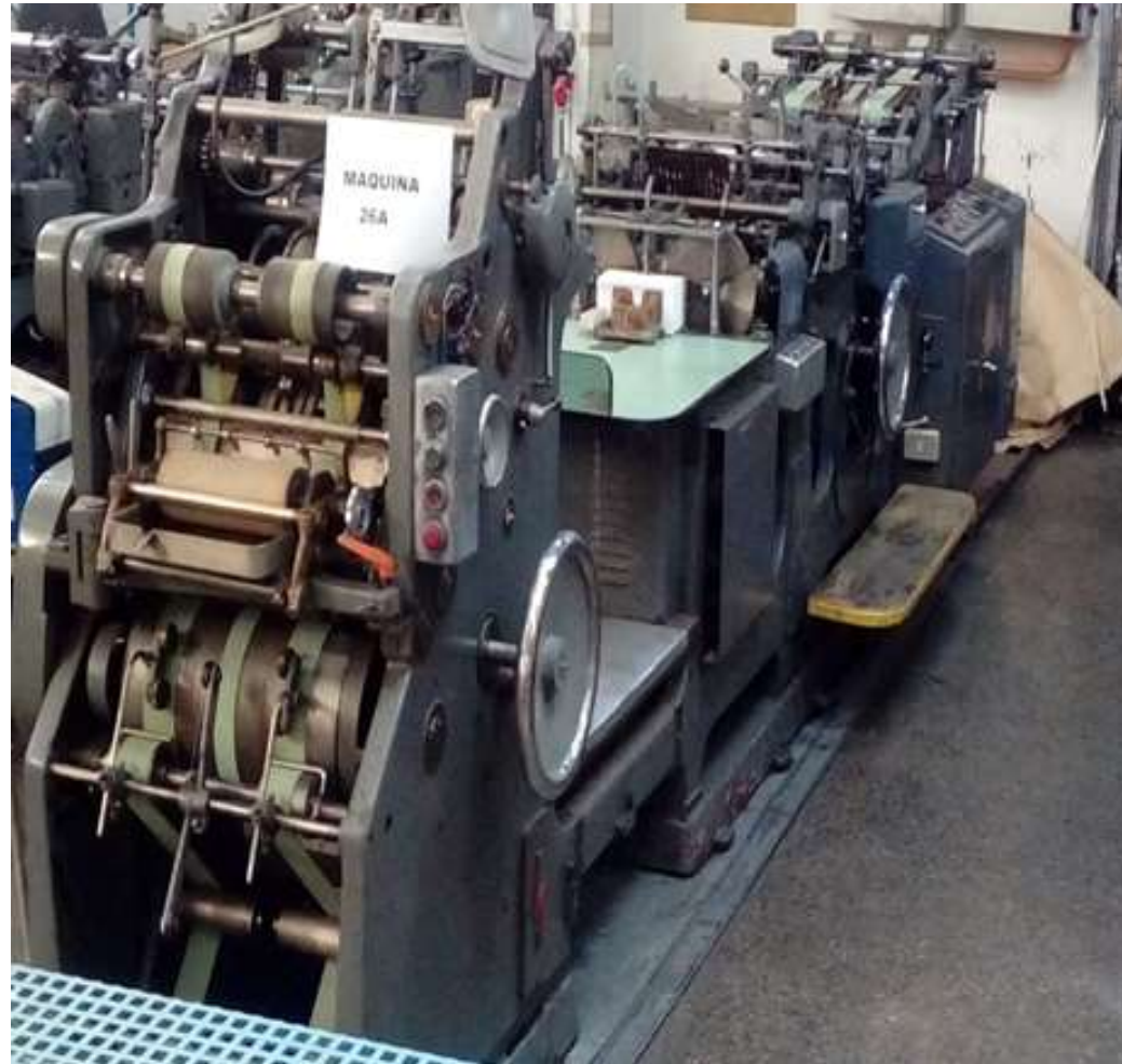
MAQUINA 26A WINKLER DUNNEBIER Nº 9671 AÑO 1981 ARMADORA DE SOBRES

FORMATOS VISITA 7 X 10.5 CM - ESQUELA 9.3 X 13.6 -CARTA CLASICO 12.4 X 15.4 AMERICANO 10 X 23 - MEDIA CARTA 15 X 22.5 -TARJETA 10.5 X 18.8 -Y CARTERA CD 12.3 X 12.3 CON SUS RESPECTIVOS REPUESTOS