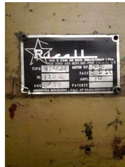
VENTILADORA DE PAPEL RICALL TIPO RTCAM DESARMADA IMAGEN DE REFERENCIA