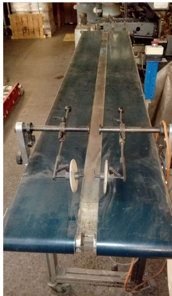
MAQUINA 212 WINKLER DUNNEBIEL IMPRESORA SOBRES CERRADOS 2/0 COLOR N° 10940 LOTE 8