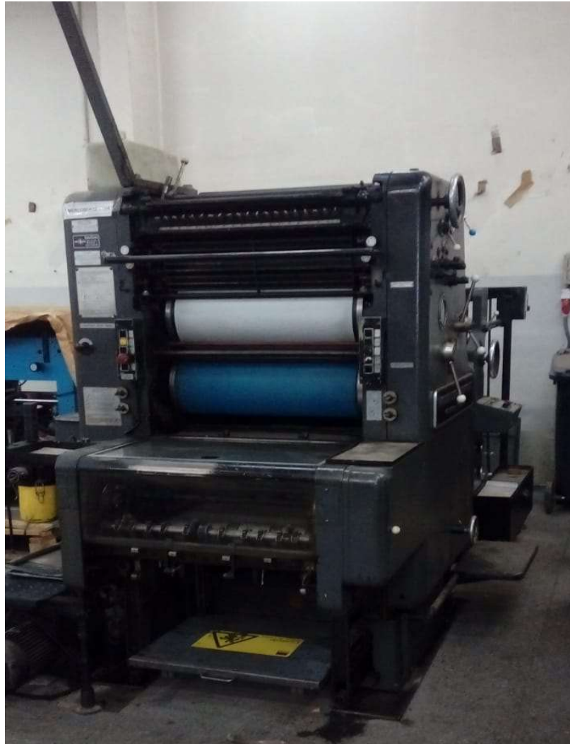
MAQUINA HEIDELBERG SORD K 1 COLOR TAMAÑO 48*62 CM N° 515482