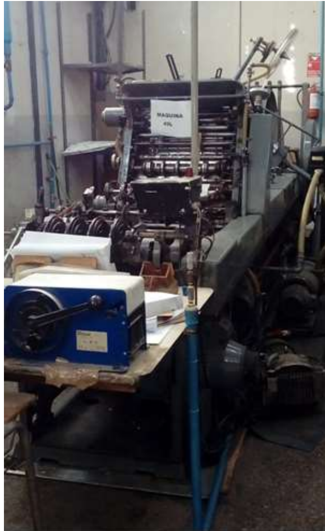
MAQUINA 49L WINKLER DUNNEBIER Nº 7116 AÑO 1970 ARMADORA DE SACOS CON Y SIN DRY LETTER FORMATOS 9 X 13 - 9 X 40- 25 X 36 -SACO REVISTA-SACO POLIZA- 20 X 28 CM. CON GOMA Y DRY LETTER EN SOLAPA CON SUS RESPECTIVOS REPUESTOS