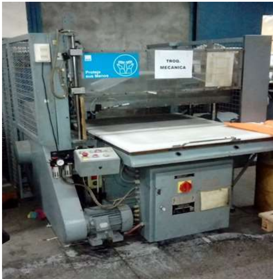
TROQUELADORA MECANICA PARA SOBRES MARCA WINKLER DUNNEBIER MODELO HELIOS 983 Nº 12030 AÑO 1991 CON TROQUELES