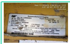
Serie Motor LH