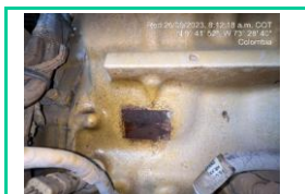
Serie Motor LH