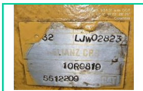
Serie Motor LH