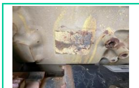
Serie Motor LH